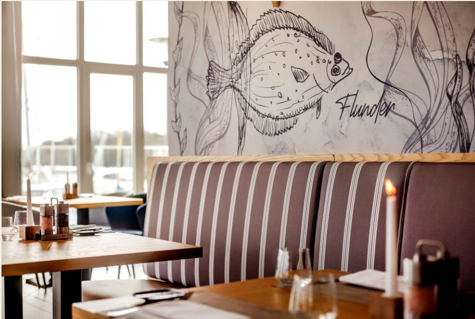
BU: Im Restaurant 1803 werden das Frühstücksbuffet und am Abend das Menü oder à la carte serviert