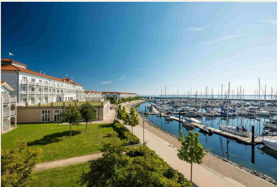
Lindner Hotel Boltenhagen und BEECH Resort Boltenhagen

Zur Wiedereröffnung laden das Lindner Hotel Boltenhagen und das BEECH Resort Boltenhagen am 20. April 2024 zum Tag der Offenen Türe ein