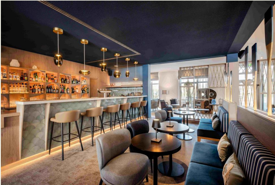
BU: Die wiek-bar ist ein Treffpunkt für den ganzen Tag