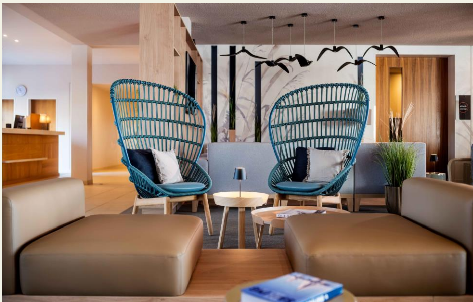
BU: Alles ruft nach Urlaub: Die Lobby im Lindner Hotel Boltenhagen