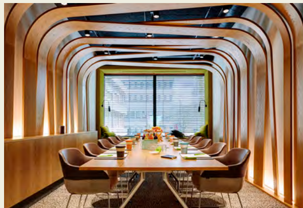
↑ Tagungsraum Ideenlaube im Lindner Hotel Düsseldorf Seestern