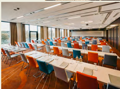
← Tagungsraum Grid 1-3 im Lindner Hotel Nürburgring Congress